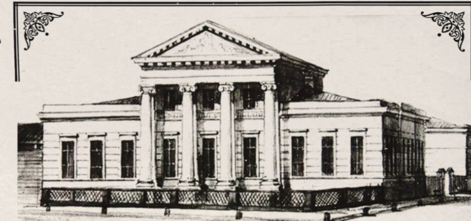
СТУПИНСКАЯ ШКОЛА ЖИВОПИСИ, XIX ВЕК, РИСУНОК СОВРЕМЕННОКА. НАХОДИЛОСЬ ЗДАНИЕ НА ПЕРЕСЕЧЕНИИ УЛИЦЪ ПРОГОННОЙ И ТРОИЦКОЙ (СОВРЕМЕННЫЕ УЛИЦЫ СОВЕТСКОЙ И СТУПИНА)

В 1802 году он открыл детскую школу живописи с библиотечкой и выставочной галереей. Эта школа стала широко известна среди творческой интеллигенции и была первым частным учреждением такого рода в России.