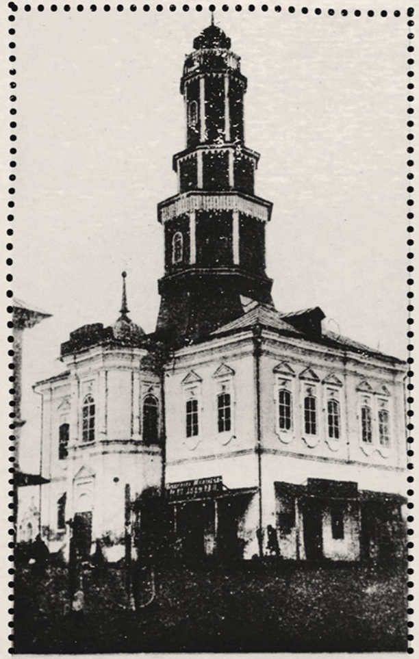
Арзамасский Магистратъ, построенный, кроме каланчи, въ XVIII столѣтнѣ.

Судебная реформа 1864 года магистраты в Российской империи упразднила. Но здание городской управы в Арзамасе осталось, и до сих пор радует всех своим барочным очарованием, вполне гармонично соседствуя с православными храмами на Соборной площади. Кстати, внутри него сохранились невероятной красоты изразцовые печи. Загляните полюбопытствовать! Задомно можно познакомиться с уникальной экспозицией музея Русского патриаршества.