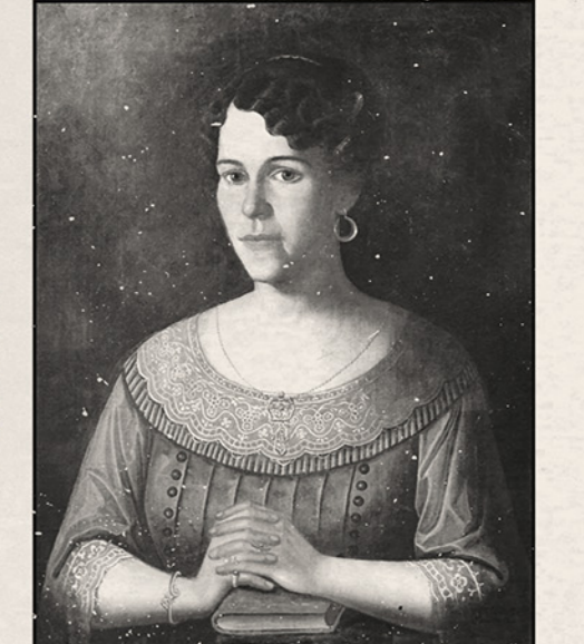
16 НОЯБРЯ 2022 Г. КОЛЛЕКЦИЯ ЖИВОПИСИ АРЗАМАССКАГО ИСТОРИКО-ХУДОЖЕСТВЕННОГО МУЗЕЯ ПОПОЛНИЛАСЯ КАРТИНОЙ А.В. СТУПИНА «ПОРТРЕТ НЕИЗВЕСТНОЙ С КНИГОЙ»