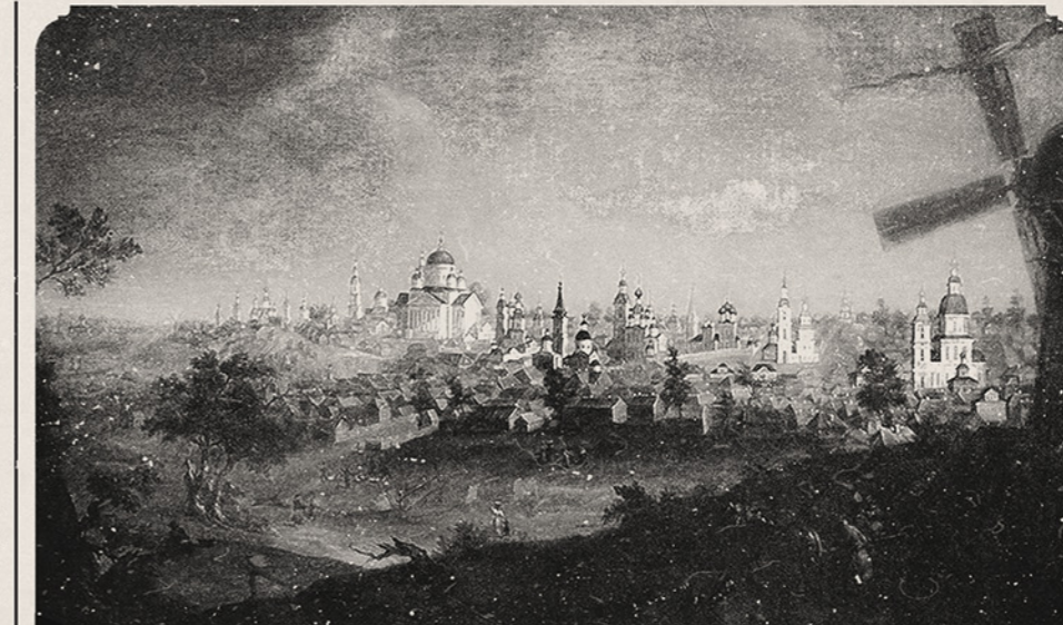
Ступин А.В. Вид города Арзамаса 1826 год Государственный Русский Музей, г. Санкт-Петербург

Сделано с любовью к городу, Анастасия и Надежда